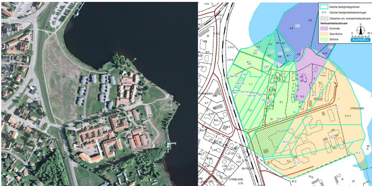
Figur 1. a) Bild över området Saxnäs idag

I Saxnäs (Saxvikens udde), Mora kommun låg tidigare två sågverk Ströms Sågverk (1920-1970) och Saxvikens sågverk (1892-1978). Korsnäs AB hade också kontor på Saxvikens udde (Figur 1 b). Området är nu bebyggt med bostäder. Fyra studier har undersökt marken på Ströms sågverksområde (Eriksson M, 2012a, Eriksson M, 2012b, Lundgren N, 2013a, Lundgren N, 2013b) och en markundersökning har gjorts på Saxvikens sågverksområde (Lidén PO, 2012). Undersökningarna har pekat ut dioxiner i marken som de ämnen som kan bedömas utgöra den största risken för negativa hälsoeffekter på människor boende i området. Pentaklorfenol har använts för att impregnera virket via doppning och eventuell besprutning och har efterlämnat dioxiner i marken, med högst halter där de tidigare doppningskaren var lokaliserade. Dioxiner kan finnas som förorening i pentaklorfenol, men kan även bildas via mikrobiell nedbrytning i marken av pentaklorfenol.