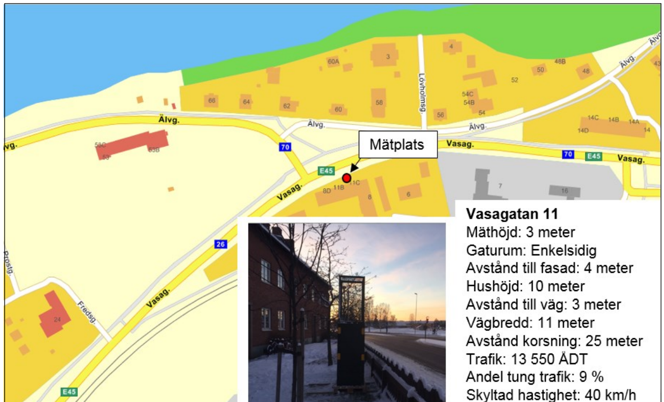
Figur 1: Beskrivning av mätplatsen vid Vasagatan 11 (karta från Eniro.se)

Mätplatsens läge och gaturummens utformning visas i figur 1. Mätplatsen är belägen på insidan av staketet mot Vasagatan ca fyra meter från närmsta fasad. Gaturummet är enkelsidigt bebyggt på södra sidan Vasagatan och trafikeras av ca 13 550 fordon per årsmededugn och 9 % tung trafik. Insuget för mätluften var placerad ca 3 meter ovan omgivande marknivå och Vasagatans körbana. Placeringen av mätutrustningen uppfyllde Naturvårdsverkets föreskrifter för kontroll av miljökvalitetsnormer i utomhusluft NFS 2016:9.