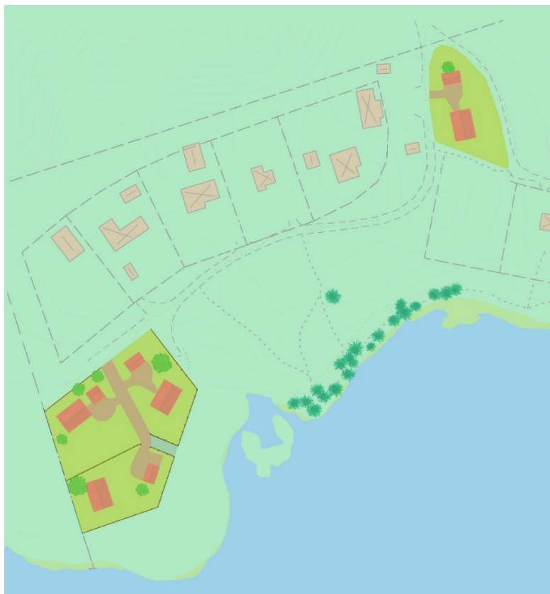
Bild 1 Skiss över hur planområdet kan bebyggas, västra delen och östra delen.

Material och färgsättning ska anknyta till och harmoniera med omgivande bebyggelse.