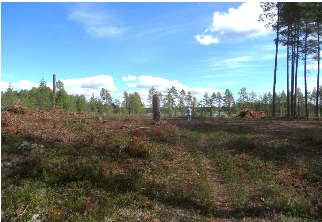
Bild 3 Västra delen av planområdet med sjön i bakgrunden. På bilden syns även en vältrampad stig.