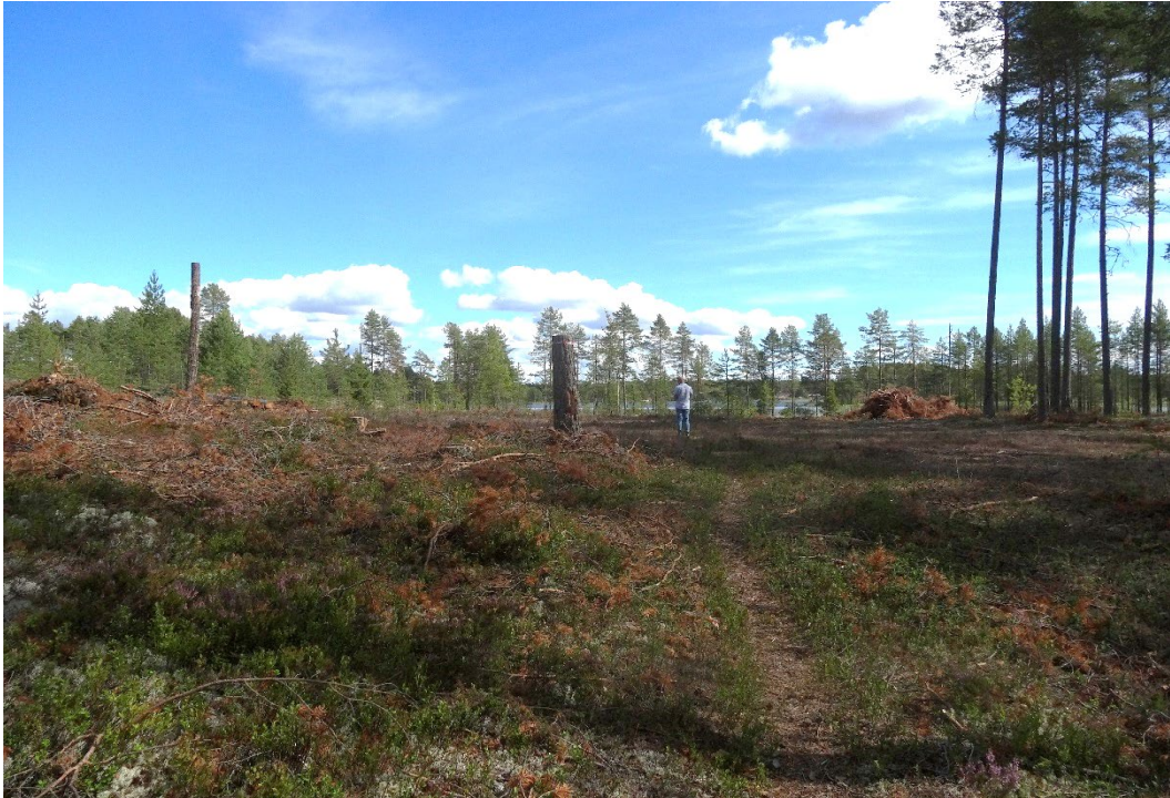
Bild 3 Västra delen av planområdet med sjön i bakgrunden. På bilden syns även en vältrampad stig.