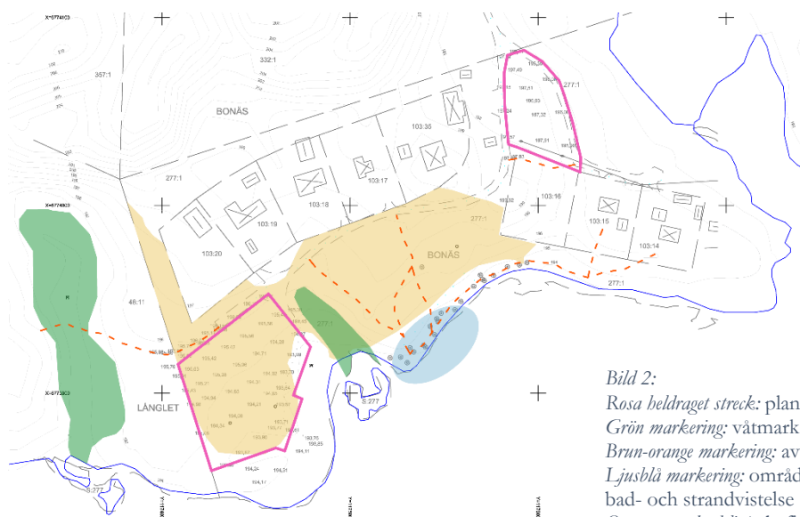
Bild 2: Rosa heldraget streck: planområdesgräns Grön markering: våtmark i form av surdrag Brun-orange markering: avverkad skogsmark Ljusblå markering: område som används för bad- och strandvistelse Orange streckad linje: befintliga stigar

Läs mer om strandskydd under rubrikerna Strandskydd och Upphävande av strandskydd .